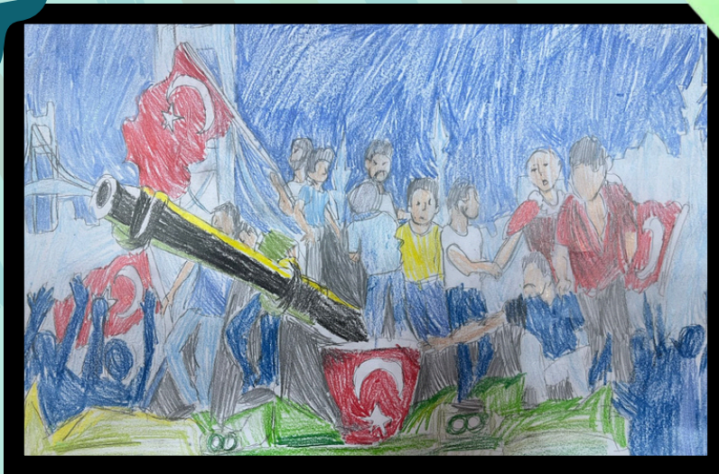
Resim: ZEYNEP ACAR - 8F