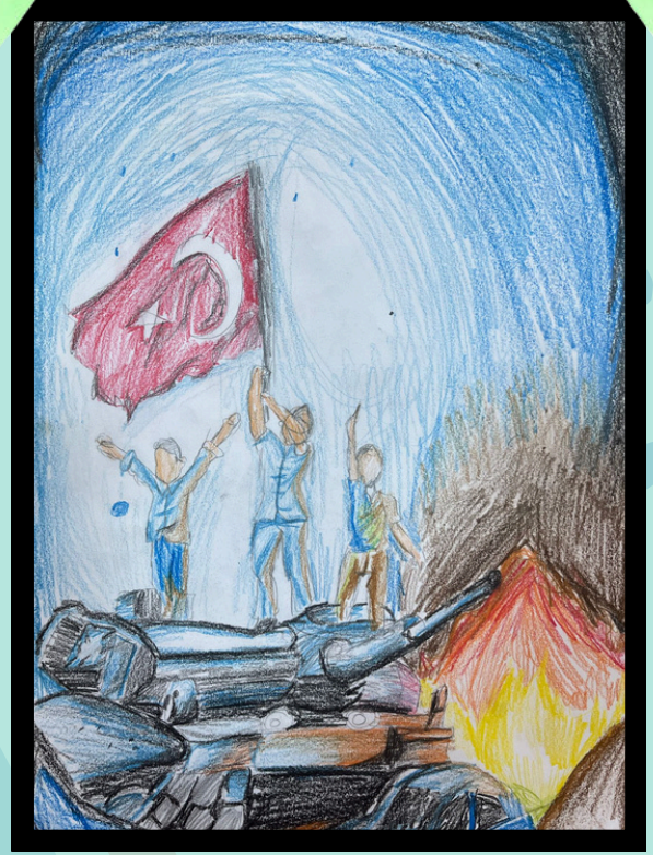
Resim: ZEYNEP ACAR - 8F

Özgürlüğümüzü bizler, Kolay kazanmadık, kolay vermeyiz. Türk milleti olarak Hiç kimseye boyun eğmeyiz.